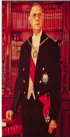
Charles de Gaulle, Président de la République

Charles de Gaulle est peut-être l'homme qui a eu la plus grande influence sur l'histoire de la France du vingtième siècle. Jeune officier, il est fait prisonnier par les Allemands pendant la première guerre mondiale. Plus tard, il préconise